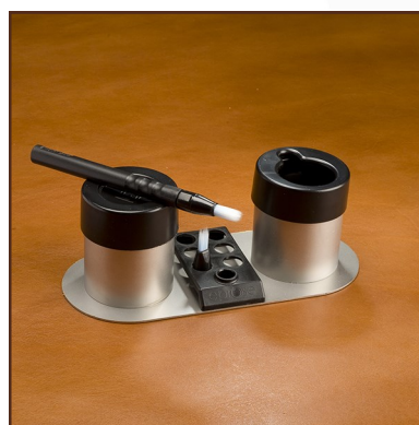
Eproglue M Kit manual Ref. 100-KPM-001