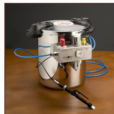
Eproglue S aplicador Ref. 100-SDC-000