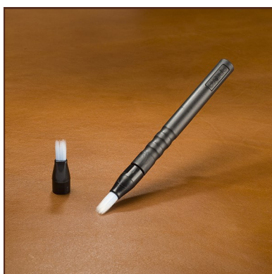
Pincel manual Ref. 100-MEP-000