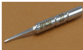
Hierro de lezna trilosangique amovible