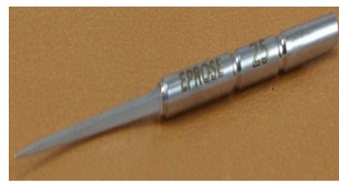
Hierro de lezna trilosangique amovible